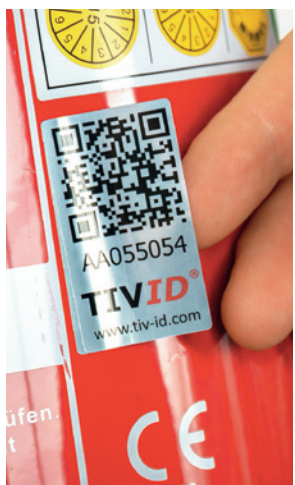
→ Der QR-Code

Für weitere Informationen, eine persönliche Beratung oder eine kostenlose Demonstration der neuen Technologie stehen wir Ihnen gerne zur Verfügung. Wir freuen uns auf Ihre Kontaktaufnahme.